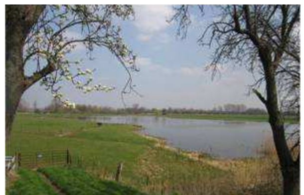
Uiterwaard bij Huis te Rumpst