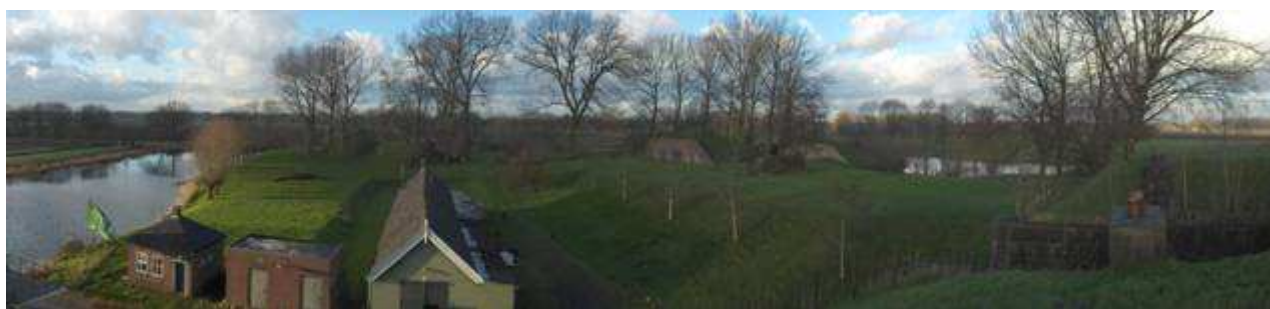
Fort bij de Nieuwe Steeg