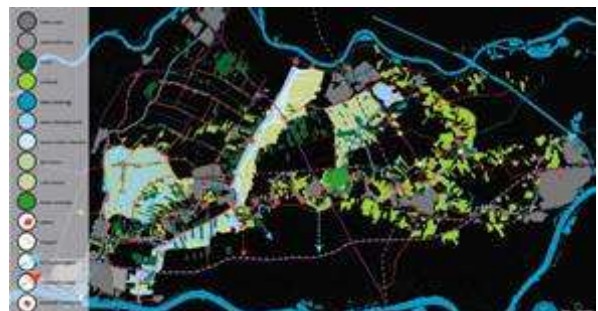
Visiekaart Recreatie in het Lingegebied (Larenstein, 2007)

De VBL heeft de totstandkoming van de Recreatievisie van de Larensteinstudenten gezien als een positieve gedachte hoe recreatie in het Lingegebied verder uitgebreid kan worden zonder de negatieve randverschijnselen waar we nu tegen aan lopen. We hebben de inzet van de studenten als erg positief ervaren en hun visie helpt ons bij het verder definiëren wat we als VBL wel en niet willen.